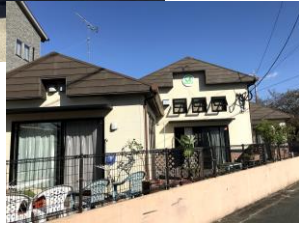
南向きの小さな庭