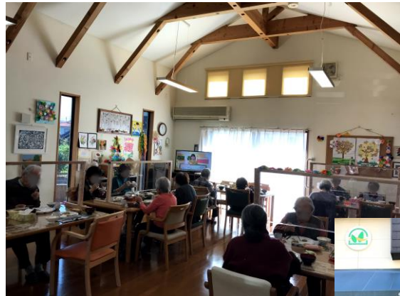
開放感のあるフロア